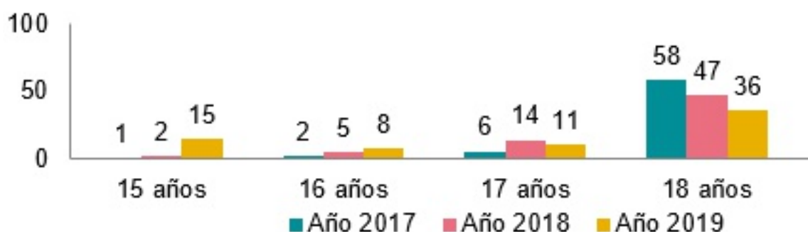
Gráfico 1 - Casos de violencia contra las mujeres de 15 a 19 años por edad registrados e informados. Tucumán.

Casos de violencia registrados e informados desde enero de 2017 hasta diciembre de 2019 en RUCVM.